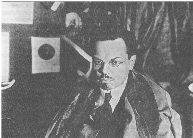
А. М. Ремизов

какую-то чурку «esprit». Спросить про этого жильца не решаюсь. Впрочем, спросить Алексея Михайловича о милых ему вещах — все равно что осведомиться о близких ему людях. С вещами связан он личной связью. Всю жизнь ходил «по карнизам» 2 — и овеществившиеся духи «еспри», «гешпенсты» охраняли его, являясь не случайно и в нужную минуту.