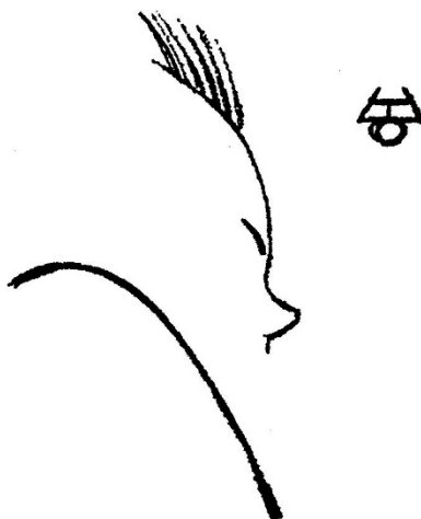
Рис. В. Масютина.

Дано в дремучем лесу на левой тропе у сороковца и подмазан собственноручно —