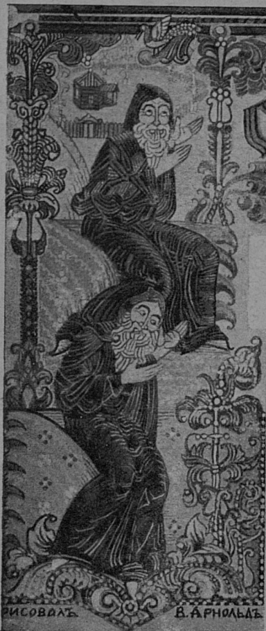
«Старцы отрока очень полюбили, и былъ онъ имъ въ утѣшеніе...»

Когда старцы вели бесѣду о божественномъ — о законѣ Господни, о проповѣди апостольской и о подвигахъ отеческихъ, видѣлъ отрокъ двухъ ангеловъ, ангелы тайно на правое ухо нашептывали старцамъ; когда же старцы разговоръ повели о житейскомъ, ангелы оставили хижину, и вошли бѣсы, два бѣса, и одинъ бѣсъ одному старцу, другой бѣсъ другому старцу тайно на лѣвое ухо принимались свое нашептывать, сами шепчутъ, сами на хартияхъ старцевы разговоры записываютъ. А исписавъ харти, взяли бѣсы на себѣ писать, и не осталось и свободнаго мѣстечка на ихъ мясницѣ бѣсовскомъ — все сплошь съ рога до хвоста и съ хвоста до пальцевъ было у бѣсовъ исписано. Но тутъ старцы въ разумъ пришли, стали кзаться и