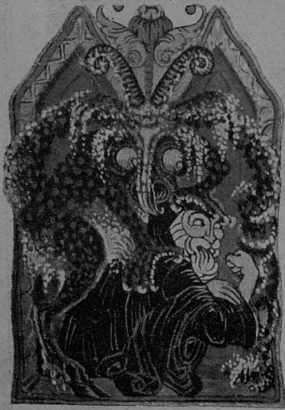
«Ты, Асафа, начальникъ блудничный, хля медвѣдя...»

Какъ-то на недѣлѣ сошлись старцы въ хижицѣ Асафа старца вечерокъ провести и по обычаю начали разговоръ о божественномъ, разговорились, да и сами того не замѣчая, перешли къ дѣламъ житейскимъ, какъ въ міру жили, ударились въ воспоминанія и впади въ празднословіе и скотомысліе, слово за слово, поспорили — Асафъ старецъ Меркурія обличаетъ, Меркурій старецъ Асафа обличаетъ.