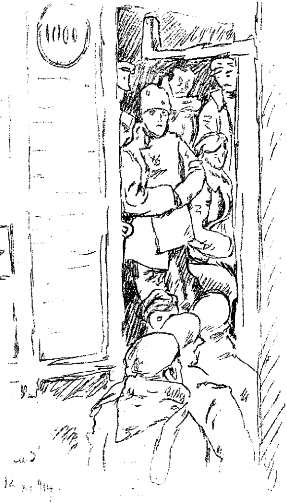
Рис. М. В. Добужинскаго.

Ксенья, опиши домой, что я до 24 (іюль) авгус. не получалъ отъ нихъ отвѣта на мои письма и передай по