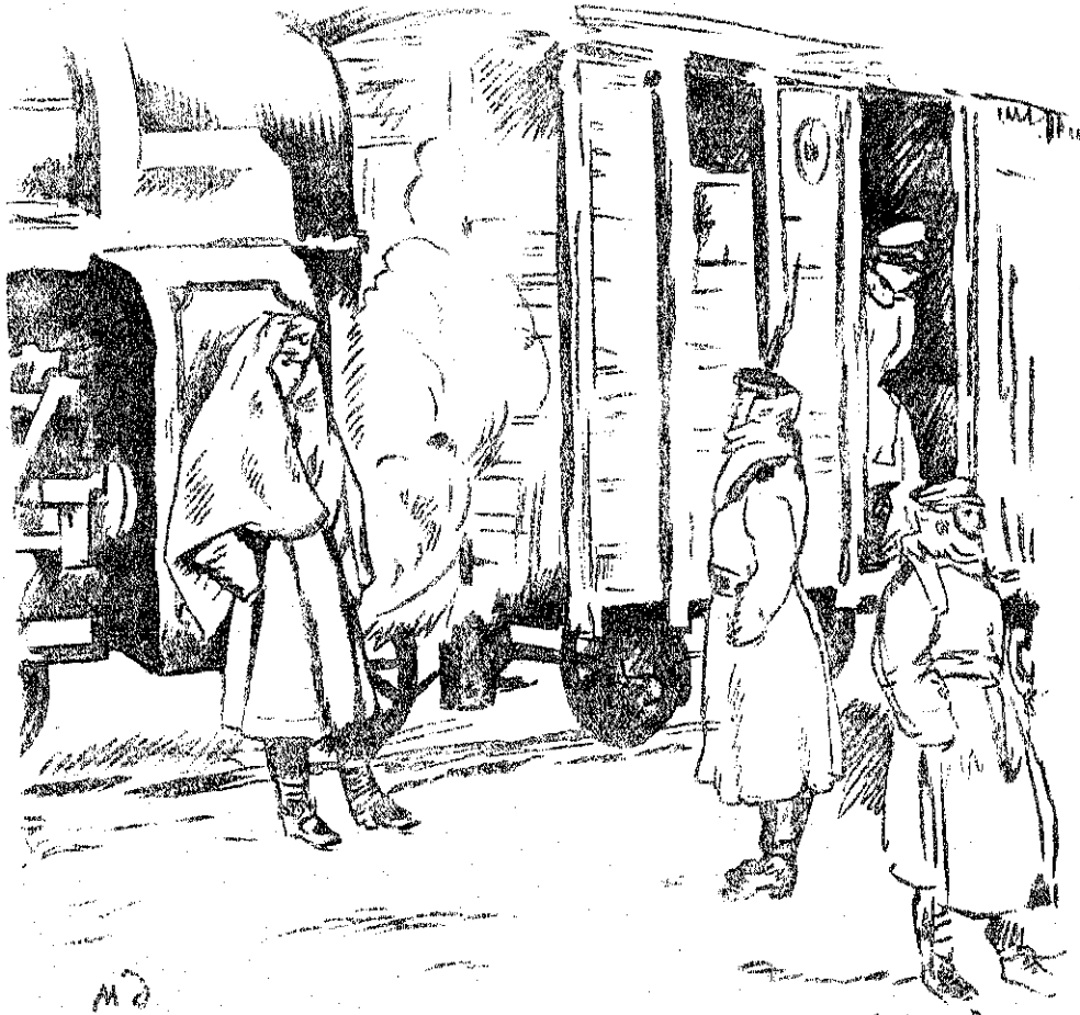
Рис. М. В. Добужинскаго.