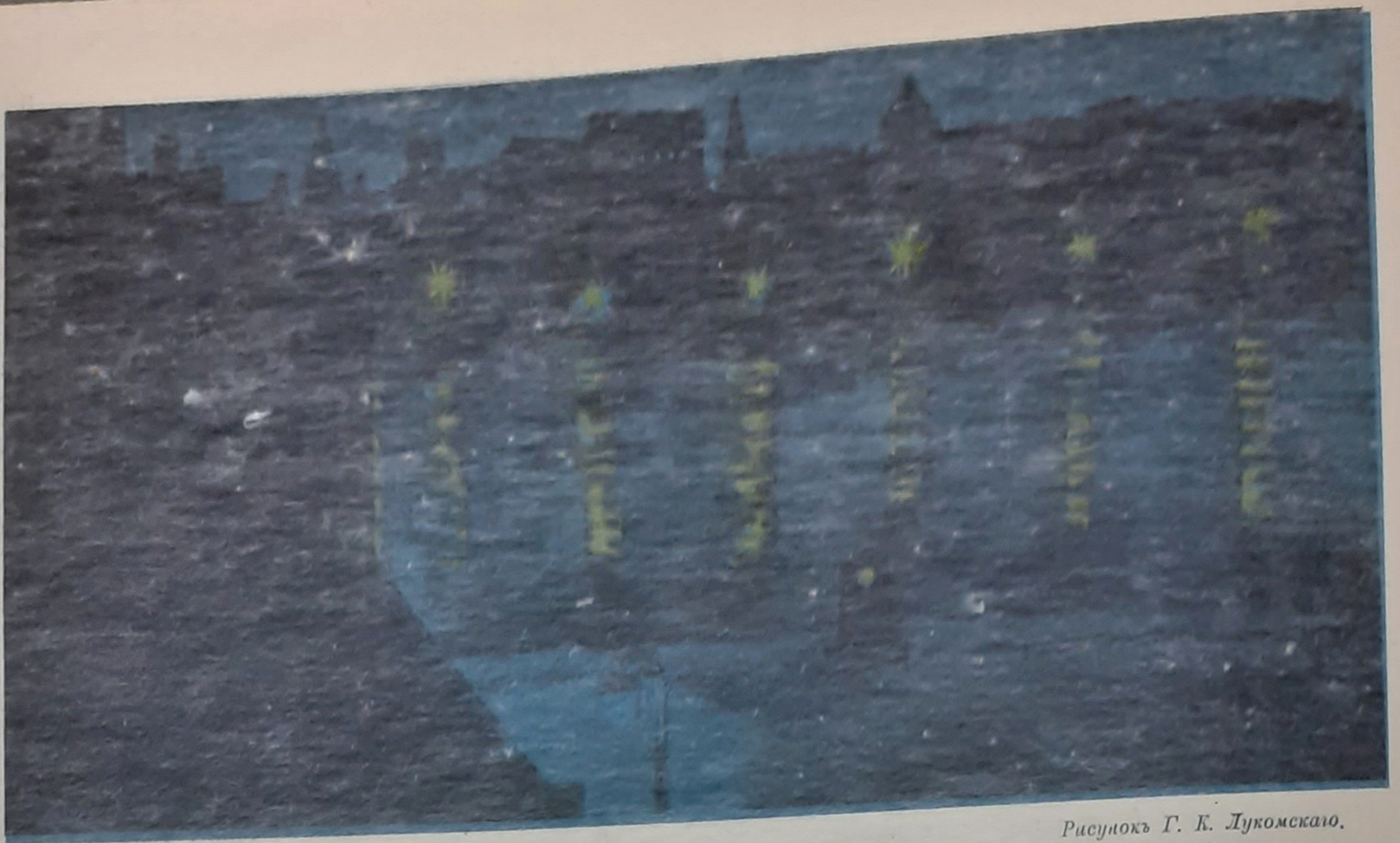
Рисунок Г. К. Лукомскаго.