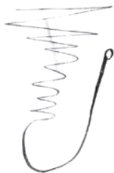
На вечерней заре. 1924 г. Глаголическая надпись («Обезвельволл»). ГЛМ